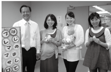
竹田区長と一緒に